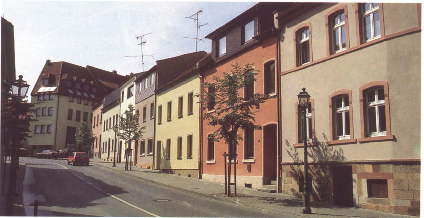
Ein gelungenes Beispiel privater Initiative in der Hünfelder Lindenstraße. Dezente Farbgebung der Häuser, die gut aufeinander abgestimmt ist, führt zu einem freundlichen Stadtbild von dem jeder, auch der Hauseigentümer profitiert.