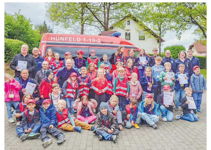
Stolzer Nachwuchs: 46 Kinder haben beim Stadtfeuerwehrtag das Abzeichen „Tatze“ erfolgreich abgelegt.