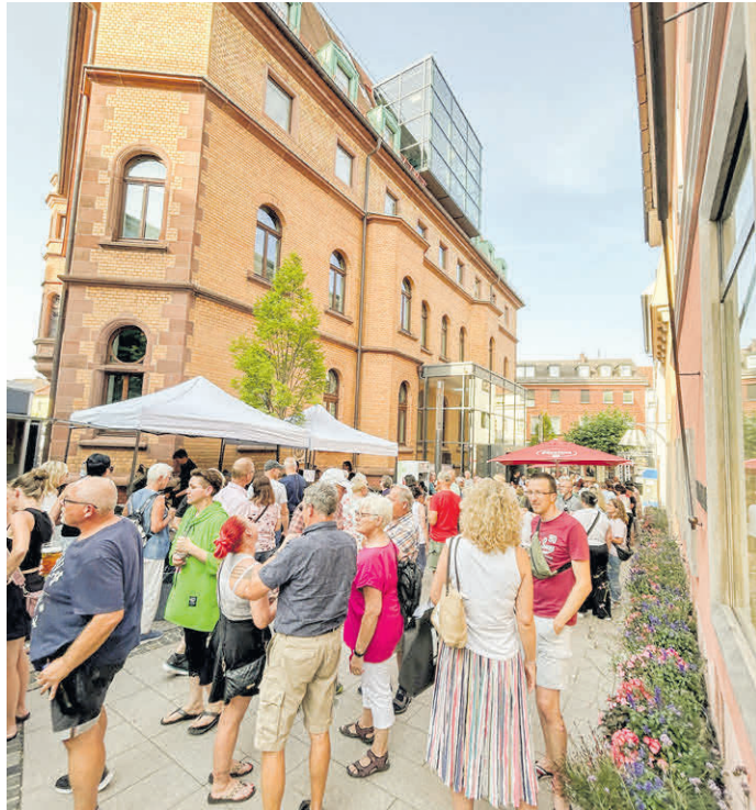
Volle Rathausgasse, beste Partystimmung und Gelegenheit zum entspannten Plausch: Das zeichnet die After-Work-Partys aus.

Am 25. Juni lädt der Lions-Club Hünfeld ein und versorgt die Besucher mit diversen Getränken der Schlitzer