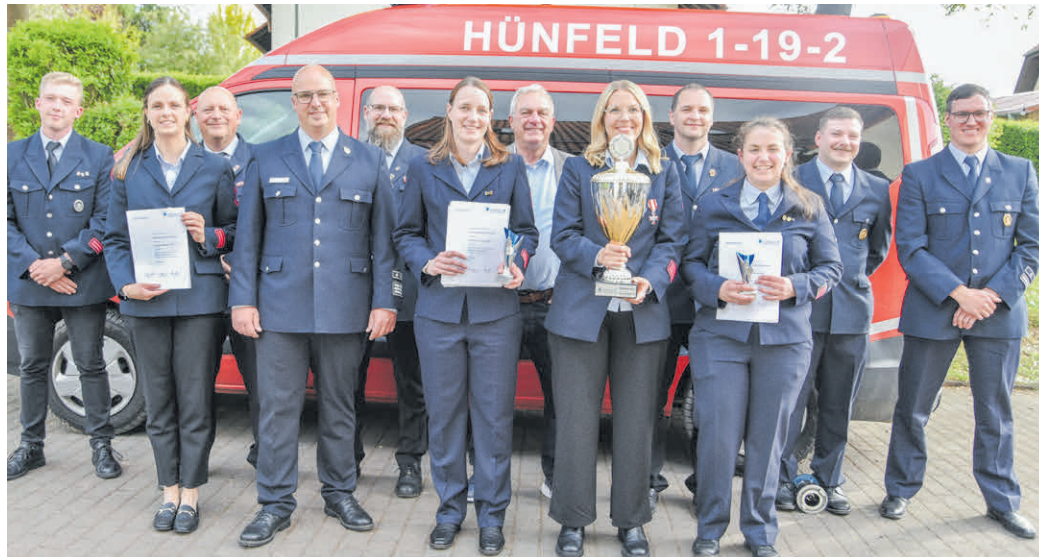
Strahlende Gesichter bei der Siegerehrung: Die Einsatzabteilung von Mackenzell gewinnt den Stadtpokal vor Großenbach 2 und Gastgeber Sargenzell.