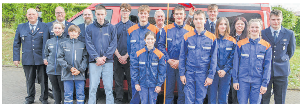
Dammersbach 1 wurde Sieger im Jugendwettbewerb Gruppe, in der Staffel gewann Mackenzell/Molzbach 1.