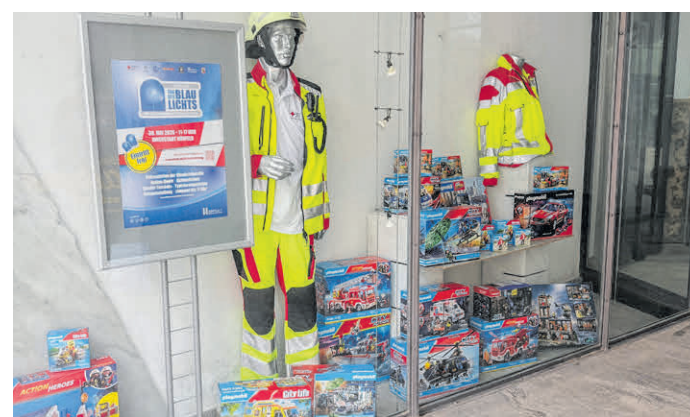
Bei der Kinder-Tombola gibt es viele Preise zu gewinnen. Außerdem erhält jedes Kind für den abgegebenen Laufpass eine Eiskugel gratis.

Ab 12 Uhr beginnt das Programm auf der Aktionsbühne